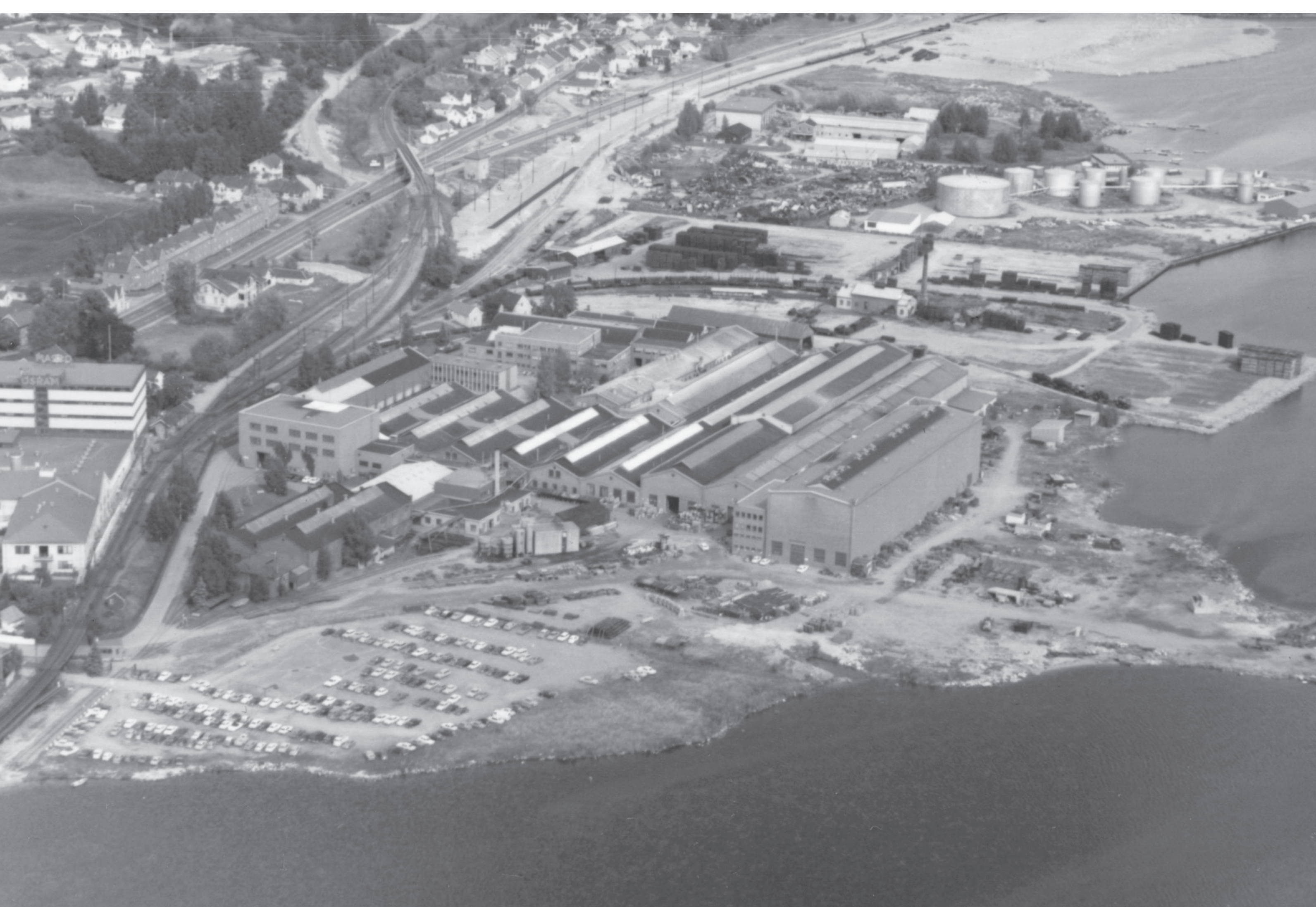
National Industri – hjørnesteinsbedrift på Brakerøya – sentral i utbygging av vannkraft