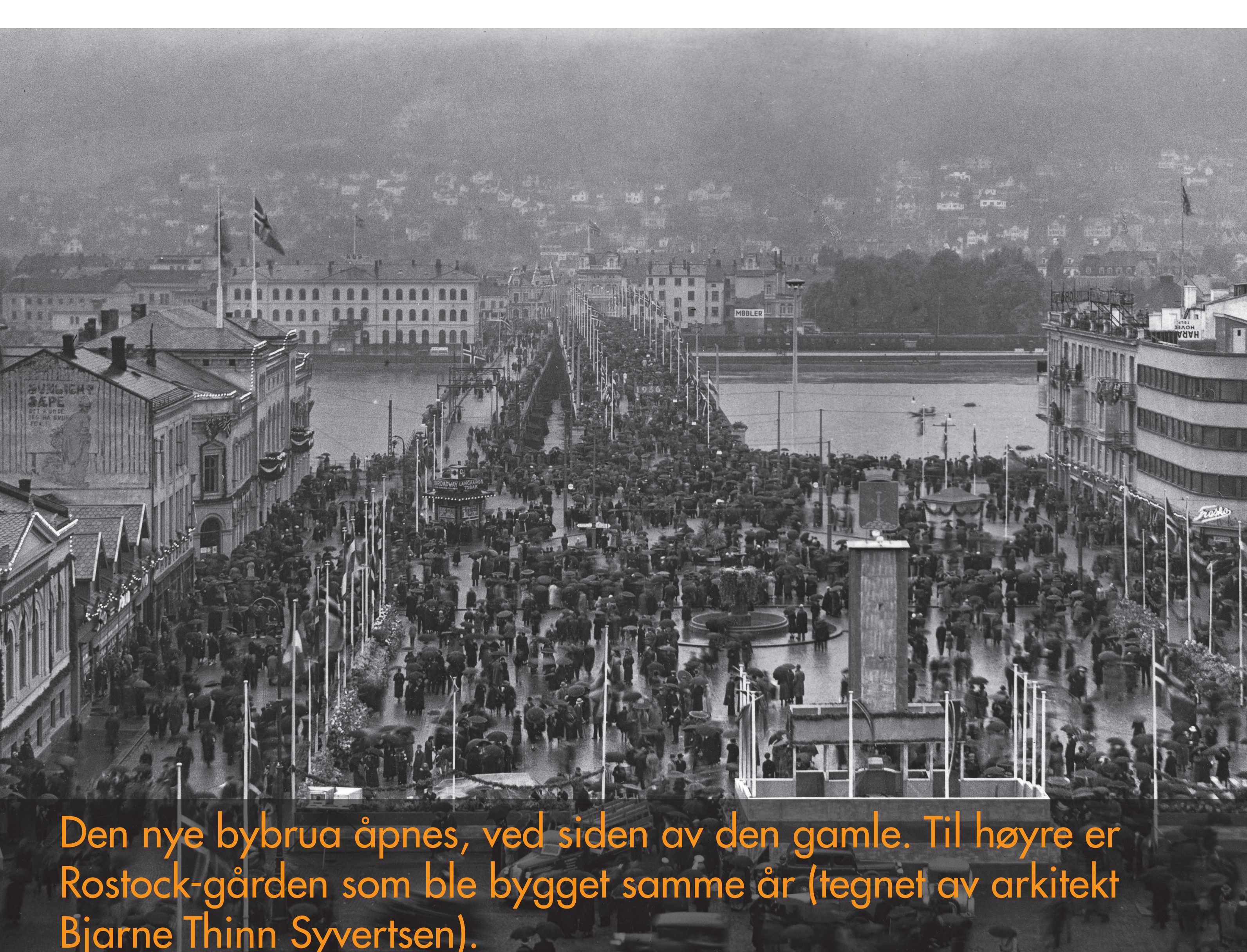
Den nye bybrua åpnes, ved siden av den gamle. Til høyre er Rostock-gården som ble bygget samme år (tegnet av arkitekt Bjarne Thinn Syvertsen).