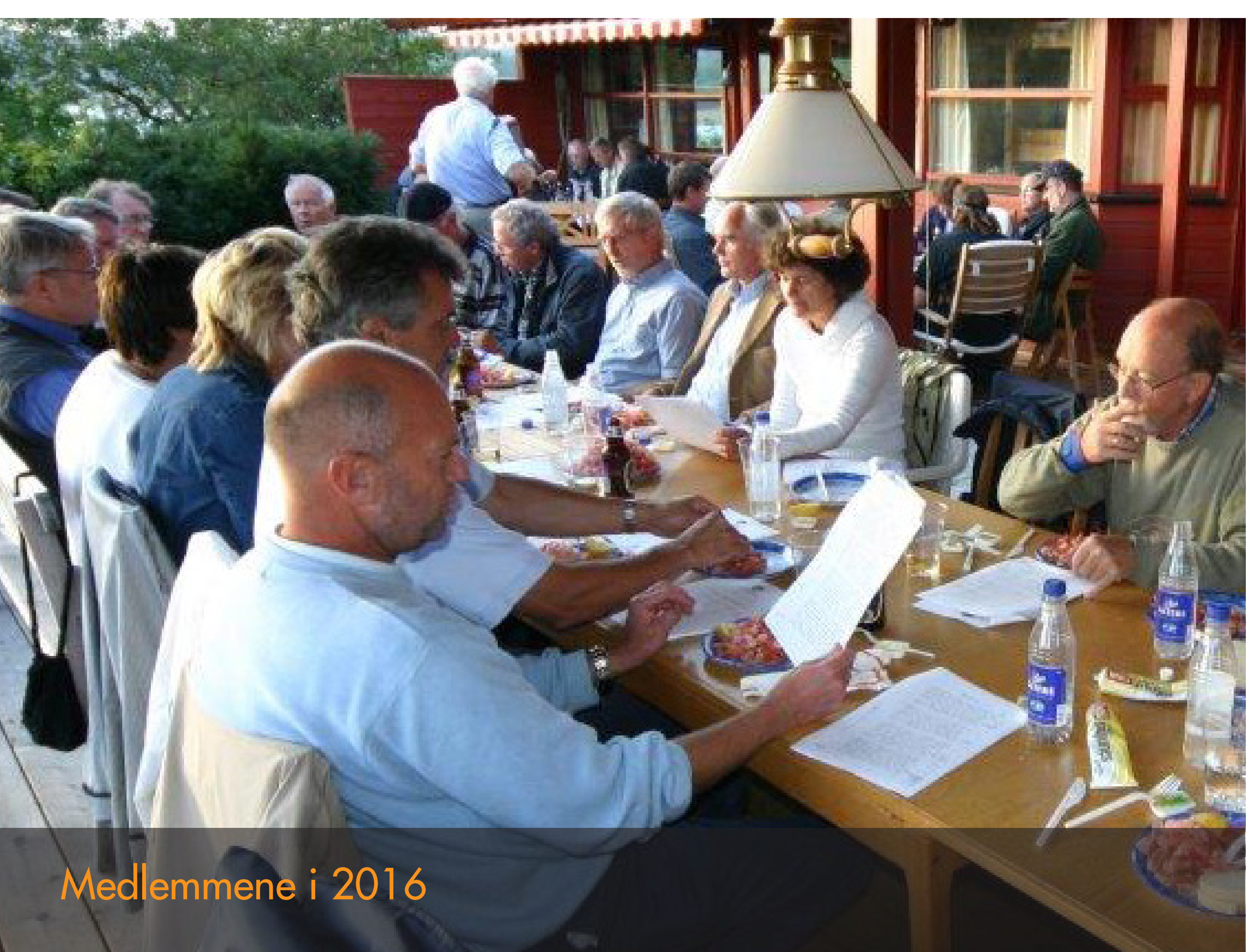
Medlemmene i 2016

Drammen Rotary har i dag ca 90 medlemmer, og som har yrkesbakgrunn som gjenspeiler dagens samfunn og næringsliv i Drammen. Våre ukentlige torsdagsmøter har et variert program med foredrag, debatter og diskusjoner. Rotary har en flat struktur, og alle verv går på omgang.