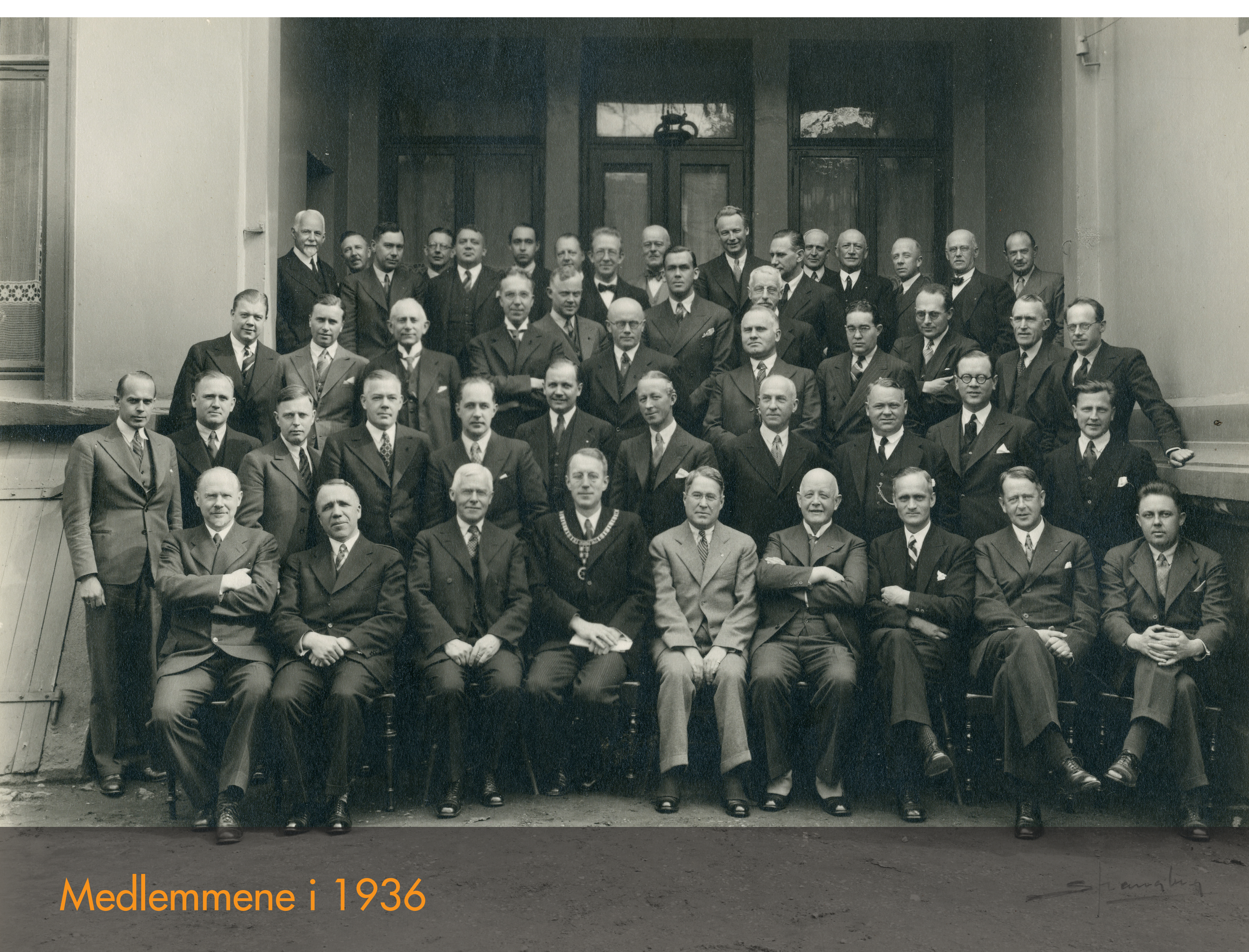
Medlemmene i 1936

Drammen Rotary Klubb ble stiftet 17. april 1936. Klubben er en yrkesbasert organisasjon som siden starten har gjenspeilet samfunn og næringsliv i Drammen; et møtested for samfunnsengasjerte drammensere, og en aktør i utvikling av byen.