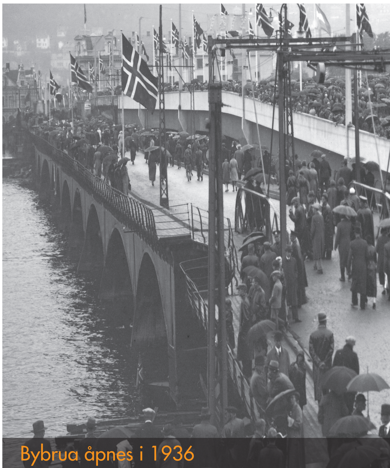
Bybrua åpnes i 1936