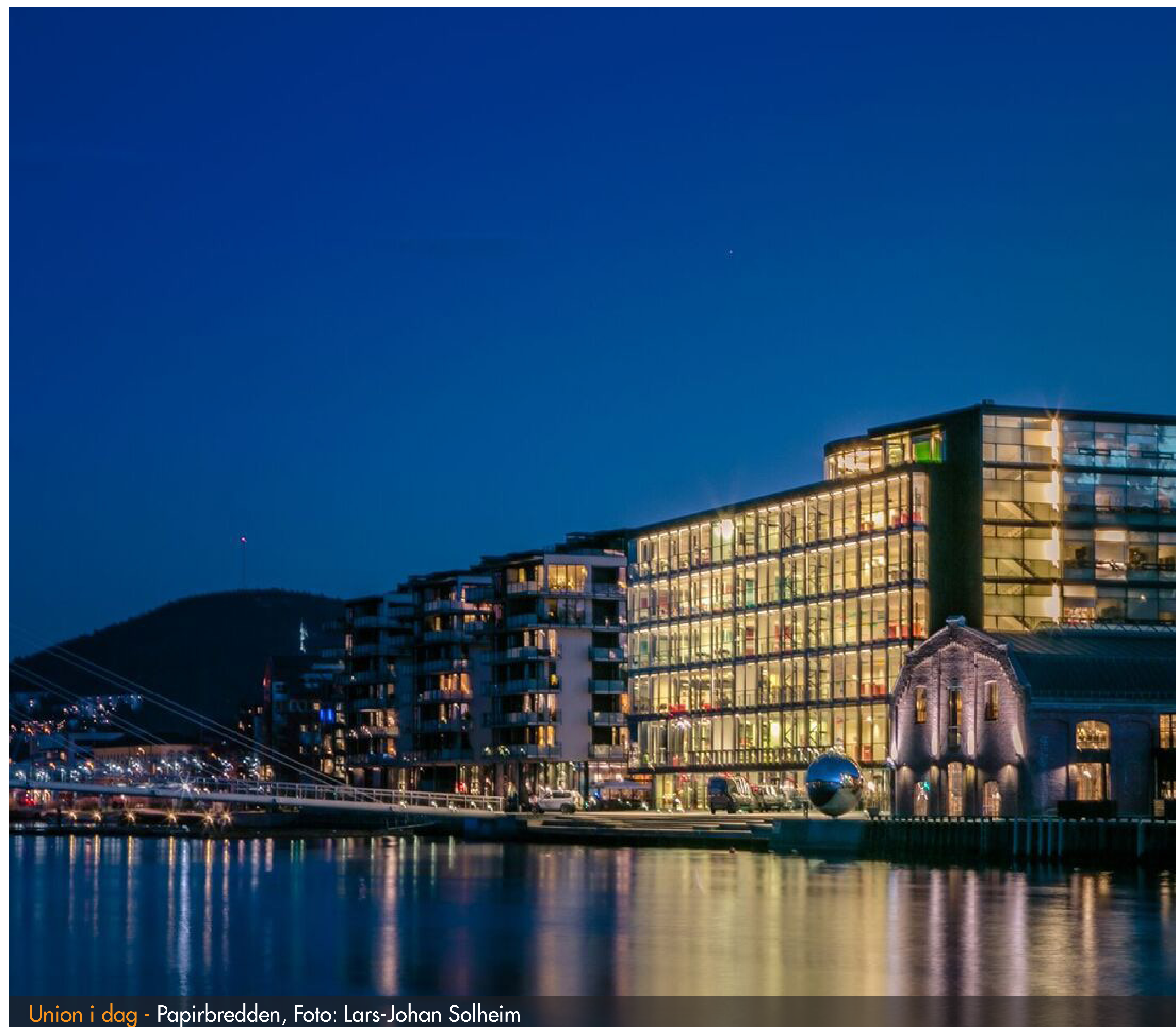
Union i dag - Papirbredden