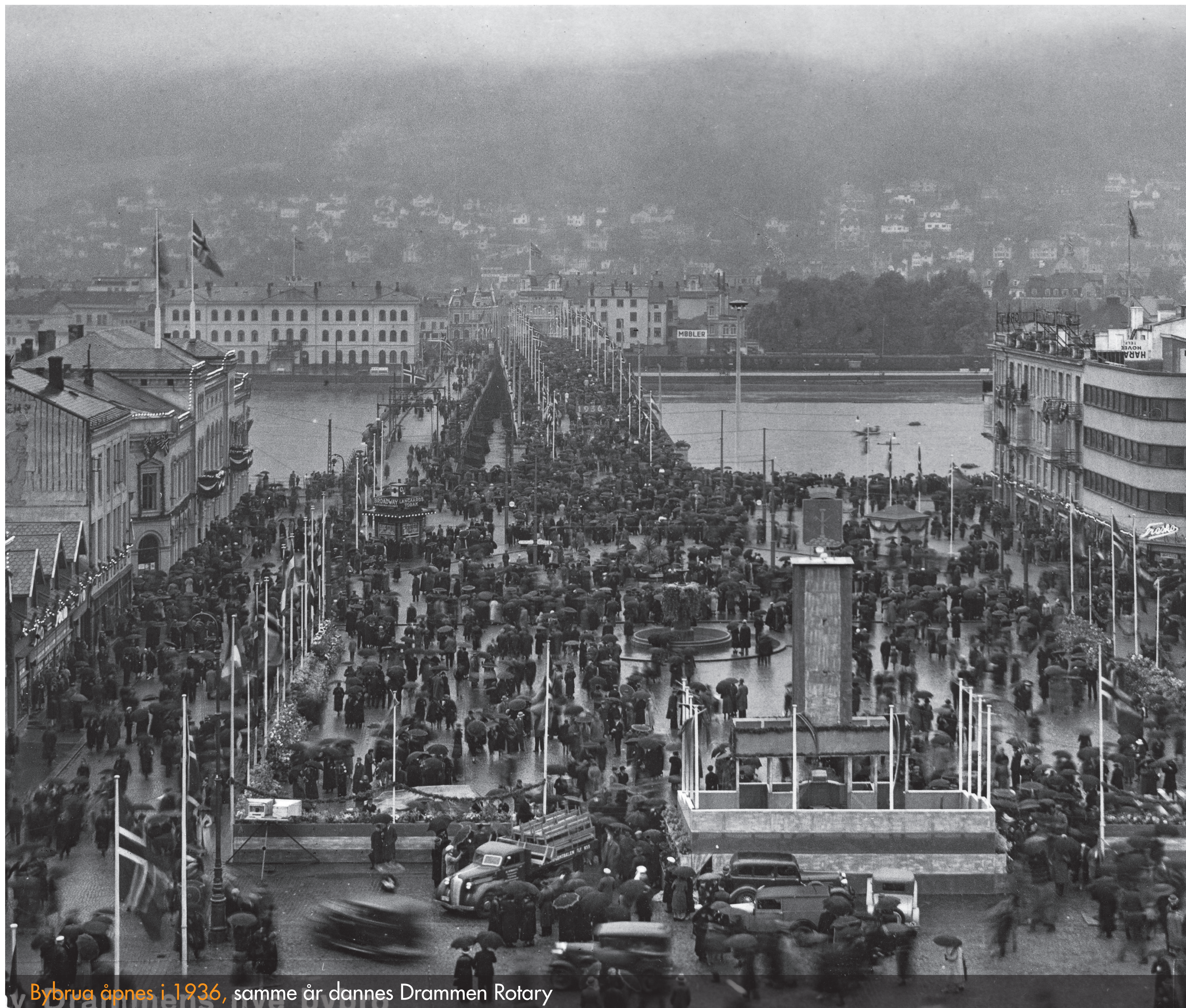
Bybrua åpnes i 1936, samme år dannes Drammen Rotary