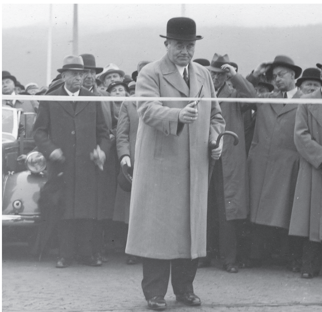
1936, Statsminister Johan Nygaardsvold klipper snoren