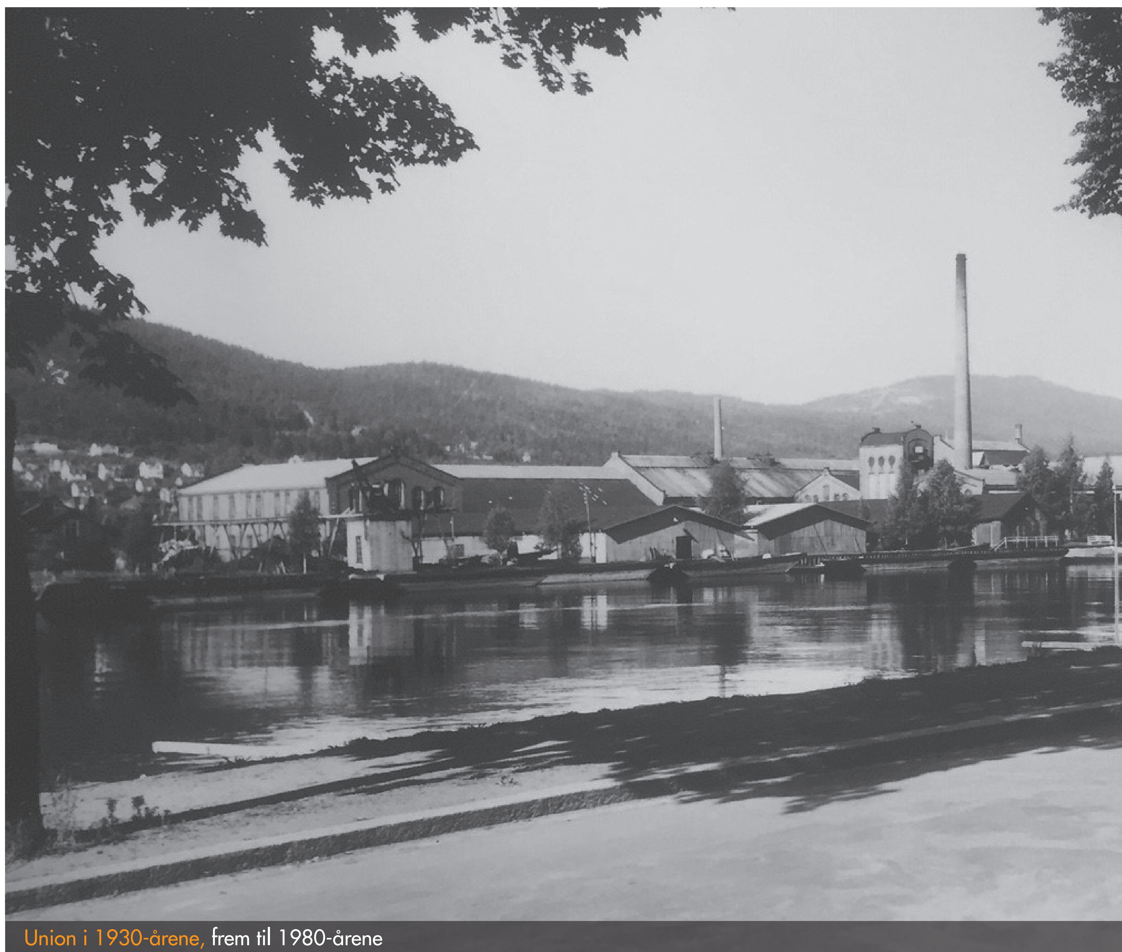
Union i 1930-årene, frem til 1980-årene

Drammen Rotary Klubb ble dannet i 1936. I løpet av disse 80 årene har det vært betydelige endringer i samfunnet. Flere av medlemmene i Drammen Rotary har vært markante i utviklingen av Drammen. Drammen Rotary ønsker, sammen med byarkivet, å vise enkelte trekk fra disse 80 årene.